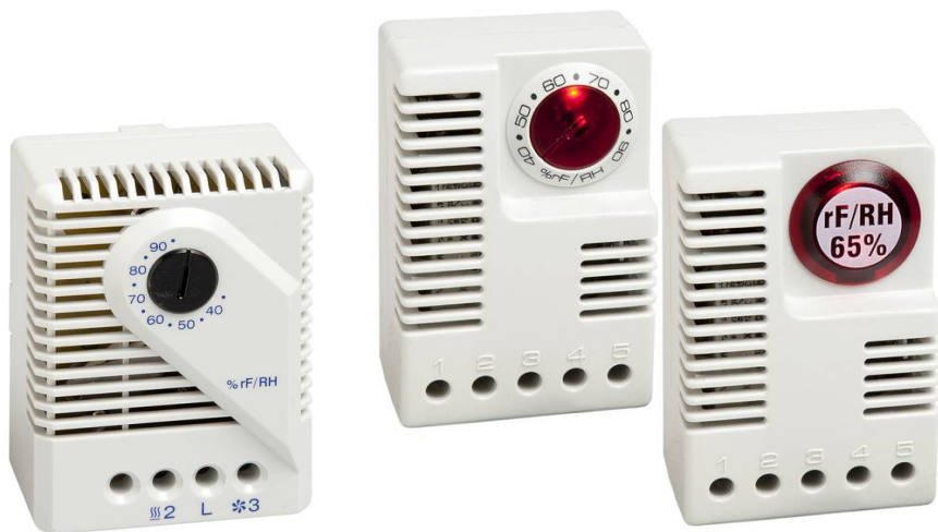
Рис. 2. Гигростаты STEGO: слева – MFR 012; справа – электронные гигростаты с регулируемой и фиксированной уставкой EFR 012

ООО «СТЕГО РУС», г. Мытищи Московской области, тел.: (495) 255-0788, e-mail: info@stego.ru , www.stego.de/ru